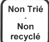
Non Trié - Non recyclé ENCOMBRANTS