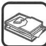
PLÂTRE ET PLAQUES DE IPLÂTRE