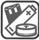
PILES ET ACCUMULATEURS