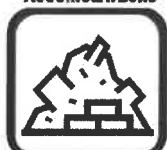
DÉBLAIS / GRAVATS

Les déchetteries du Couserans sont réservées aux déchets des ménages. Néanmoins, les entreprises, artisans, administrations, prestataires de service et personnes agissant pour le compte d'un particulier peuvent y déposer leurs déchets sous certaines conditions :